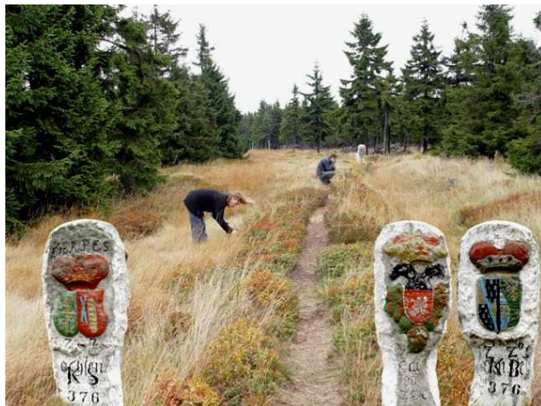
trojboký hraniční kámen (Wappenstein), nacházející se poblíž někdejší jáchymovské osady „Sluneční vír“ (bohužel v roce 2010 byl kámen ukraden)

mezi českým královstvím a německým státem. Přispělo k tomu i objevení velkého rudného bohatství na obou stranách hranice, zejména ale jáchymovských rudních žil na počátku 16. století. Zásadou rozvoje báňských prací se stal krušnohorský masiv v průběhu 16. století hospodářsky významnou oblastí v celé své stokilometrové délce.