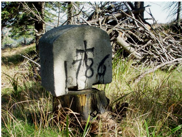
torzo hraničního kamene nedaleko od bývalé tzv. „Studené zimy“