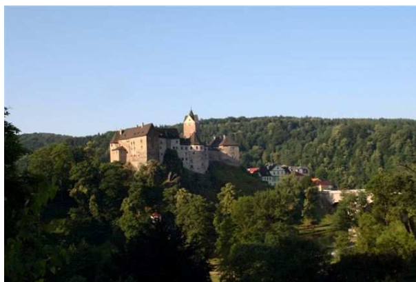
hrad Loket (2008)