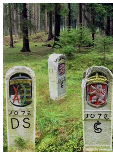
hraniční kámen u Potůčků

K nejvýraznějším jevům hospodářského života českého předbělohorského státu patřily snahy o maximální využití jáchymovského ložiska. Postupný nález více než 130 jáchymovských žil vyvolal v centrálním západním Krušnohoří nejen rušnou výrobní činnost, ale i rychlé osídlení, od něhož dříve odrazovala vysoká poloha a klimatická nepřátelskost. Proto jedině zásluhou báňských prací již v prvních letech po roce 1516 mohl v Jáchymově vzniknout rozsáhlý provoz na přibližně 1 000 důlních dílech a v souvislosti s ním i významné středisko