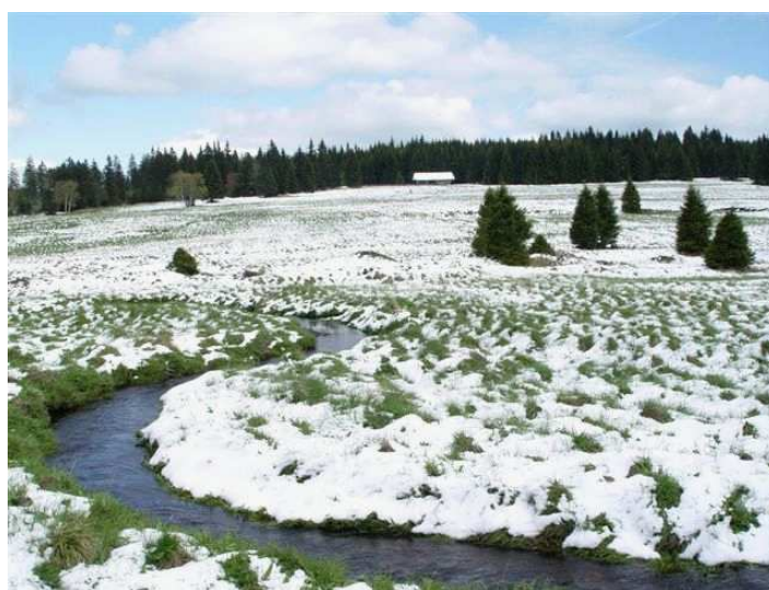
na vrcholové parovině u říčky Černé můžeme stavět sněhuláky, zatímco v nížinách se lidé koupají (24. květen, 2004)

Krušné hory neměly dlouho předpoklady pro trvalejší osídlení. Výsledek stříbrné horečky byl ovšem nade vše pochybnost – více než dvacet sídel městského charakteru a hustě zalidněný celý náhorní prostor. Právě proto dodnes žádné jiné naše horské pásmo nemá tak bohatou historii a nemá své hřebenové území osídleno tak hustě, jako je tomu v jejich případě.